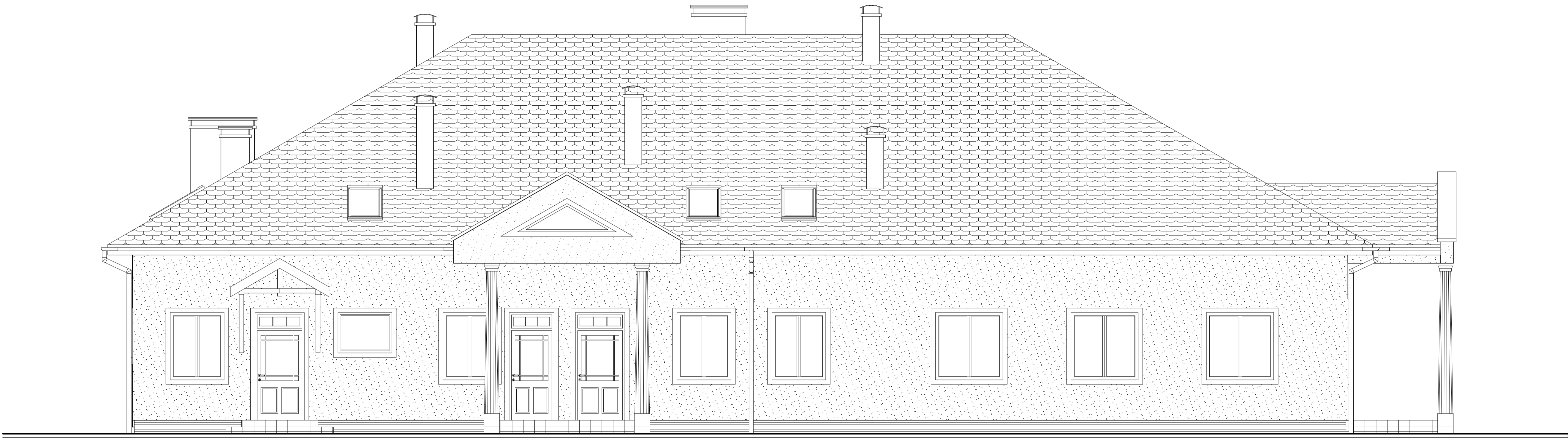
ELEWACJA II BOCZNA (POŁUDNIOWA) - SKALA 1:50